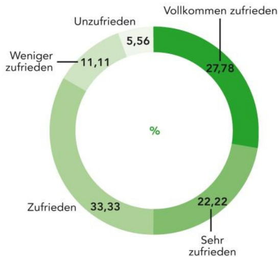
So zufrieden ist das Topmanagement mit der IT.

Immerhin können sich die ITler damit trösten, dass die Kollegen auf der Führungsebene ihnen in puncto Ergebnisorientierung mehr zutrauen als Mitarbeitern in anderen Unternehmensbereichen: 55 Prozent gaben an, die IT-Experten steuerten ihre Ziele direkter an als andere. Zudem gelten sie als jünger und besser ausgebildet.